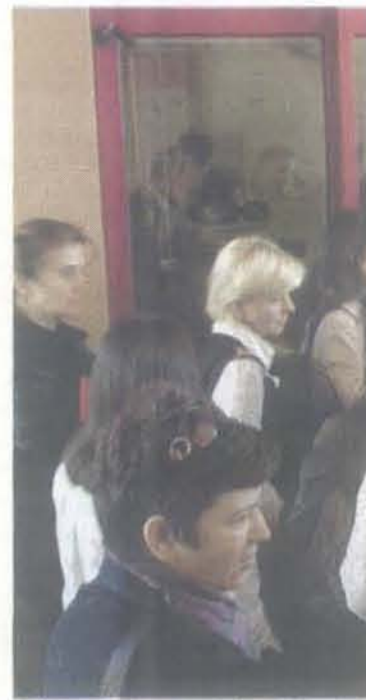
Prilikom ranijeg projekta mnogi nisu

kriterijuma, još 30 odsto kredita bilo bi rezervisano za bračne parove gdje ni jedan od supružnika nije stariji od 35 godina, a preostalih 30 odsto dobila bi ostala domaćinstva. Prioritet izbora unutar ovih kvalifikovanih grupa imala bi domaćinstva sa sa-mohranim roditeljem ili starateljem, domaćinstva čiji je član osoba sa invaliditetom, domaćinstava sa djecom sa smetnjama u razvoju, mladi ljudi koji su bili djeca bez roditeljske brige i žrtve nasilja u porodici.