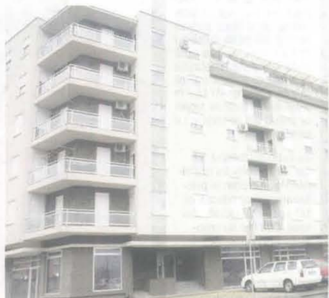
Uslovi za kredit povoljniji, niža i kamata