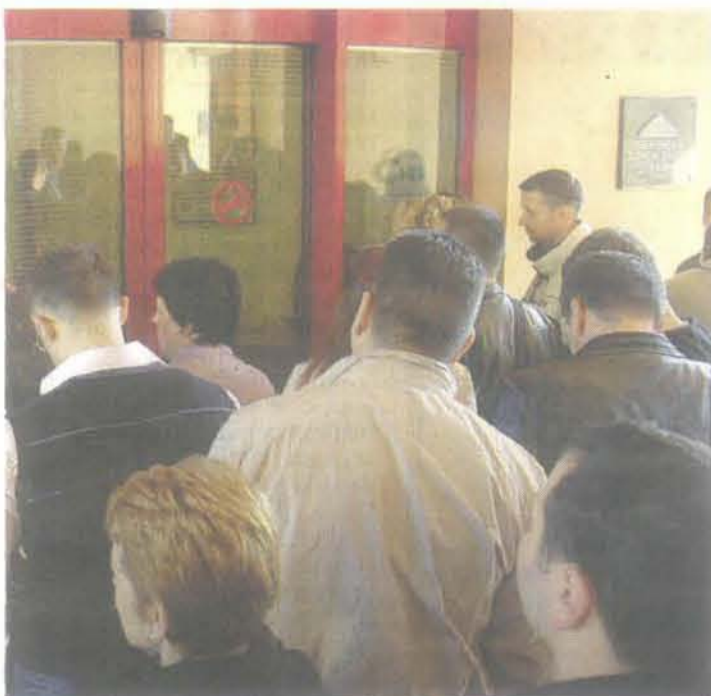
nogli ispuniti uslove, sada jednostavnije