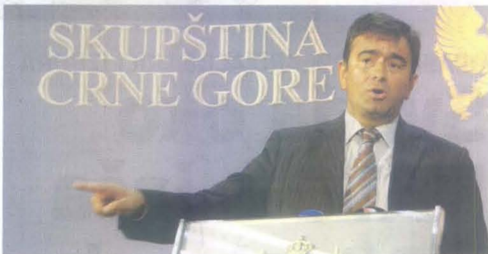
Izdaja je prihvatanje principa "ko je jamio, jamio": Medojević