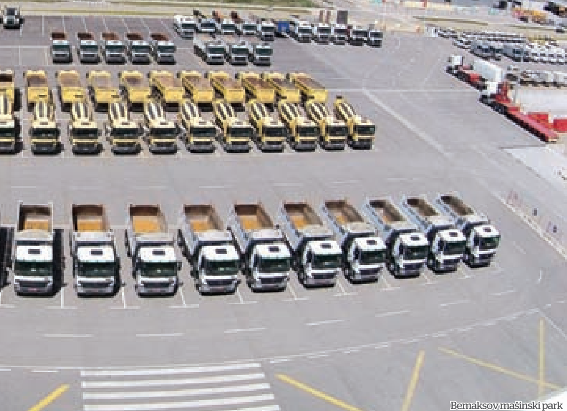
Bemaksov mašinski park