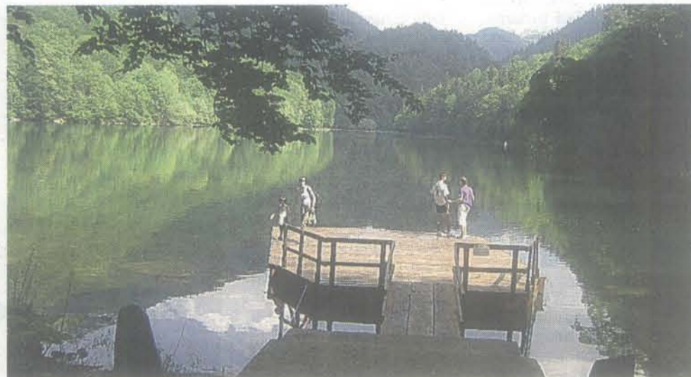
Procenat zaštićenih područja porastao na 13 odsto

“Upravo područja ekološke mreže predstavljaju kategoriju kojom će se obuhvatiti pored nacionalno važnih područja i ona