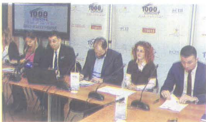
Са јучерашњег преса

ЈАВНИ ПОЗИВ ЗА ГРАЂАНЕ У ОКВИРУ ПРОЈЕКТА ХИЉАДУ ПЛУС БИЋЕ ОБЈАВЉЕН У ПЕТАК