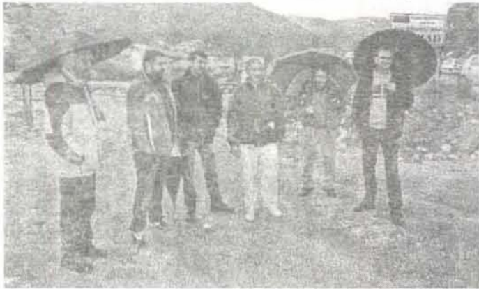
Са недавне блокаде рударског копа