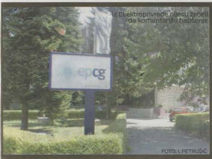
Iz Elektroprivrede nijesu zetieli da komentarišu hapšenje